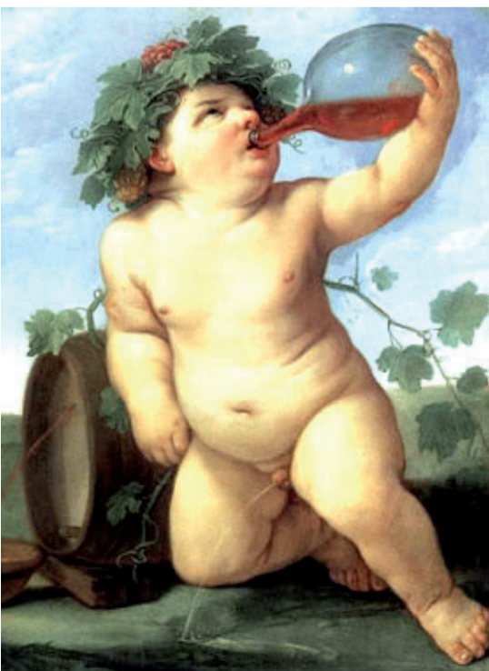
Dionysus een zoon van Zeus en Semele

De abstracte ideeën en meningen die gesloopt moeten worden, hebben in de materiële wereld hun pendant in de gecompliceerde neurale netwerken die door de hersencellen worden gevormd en ook deze laatste hebben dus gelijkelijk te lijden van het dionysische ritueel. Maar na de gebruikelijke periode van geestelijk en lichamelijk herstel - ook hersencellen kunnen zich herstellen - kan het bevrijde intellect met de losse bouwmaterialen weer nieuwe en interessante ideeën en theorieën optrekken. ‘En in dat oneindige universum’, schrijft Italo Calvino in een van zijn Memo’s voor het volgende millennium, ‘openen zich steeds andere wegen om te verkennen, heel nieuwe of heel oude, stijlen en vormen die ons beeld van de wereld kunnen veranderen...’